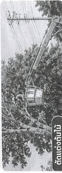
ตัดแต่งต้นไม้