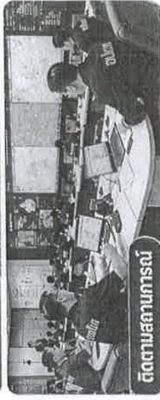
ติดตามสถานการณ์

กรมส่งเสริมการปกครองท้องถิ่น กองป้องกันและบรรเทาสาธารณภัยท้องถิ่น