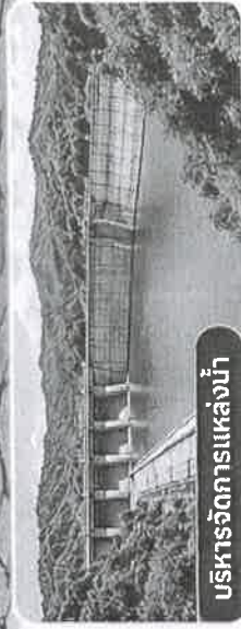
บริหารจัดการแหล่งน้ำ