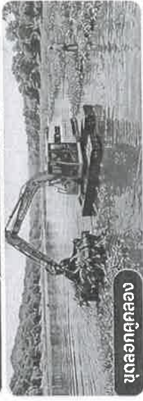
ขุดลอกคูคลอง