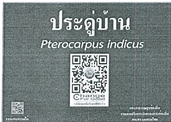
ภาพที่ 1 แสดงรูปแบบป้ายพรรณไม้ท้องถิ่น